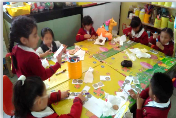
Figura 4. Implementación de la actividad: El rincón de la tiendita.