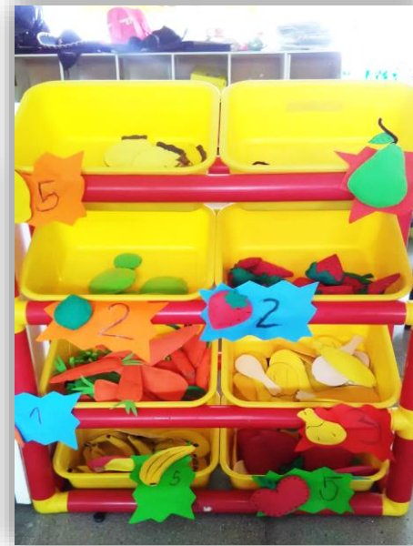
Figura 5. Imágenes de moneda para que dibujaran lo que podían comprar y precios de frutas y verduras.