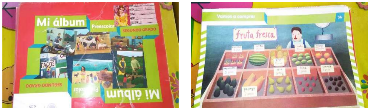
Figura 3. Álbum para segundo grado.