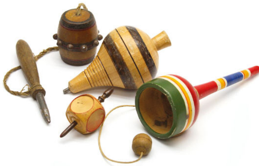
Juguetes tradicionales, fotografía de Jordi Farré/Archivo iconográfico DGME-SEB-SEP.