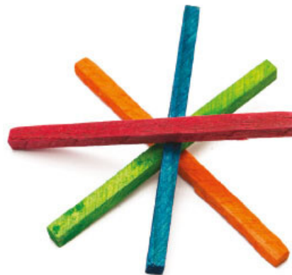
Palitos de colores, fotografía de Oswaldo Ruiz.