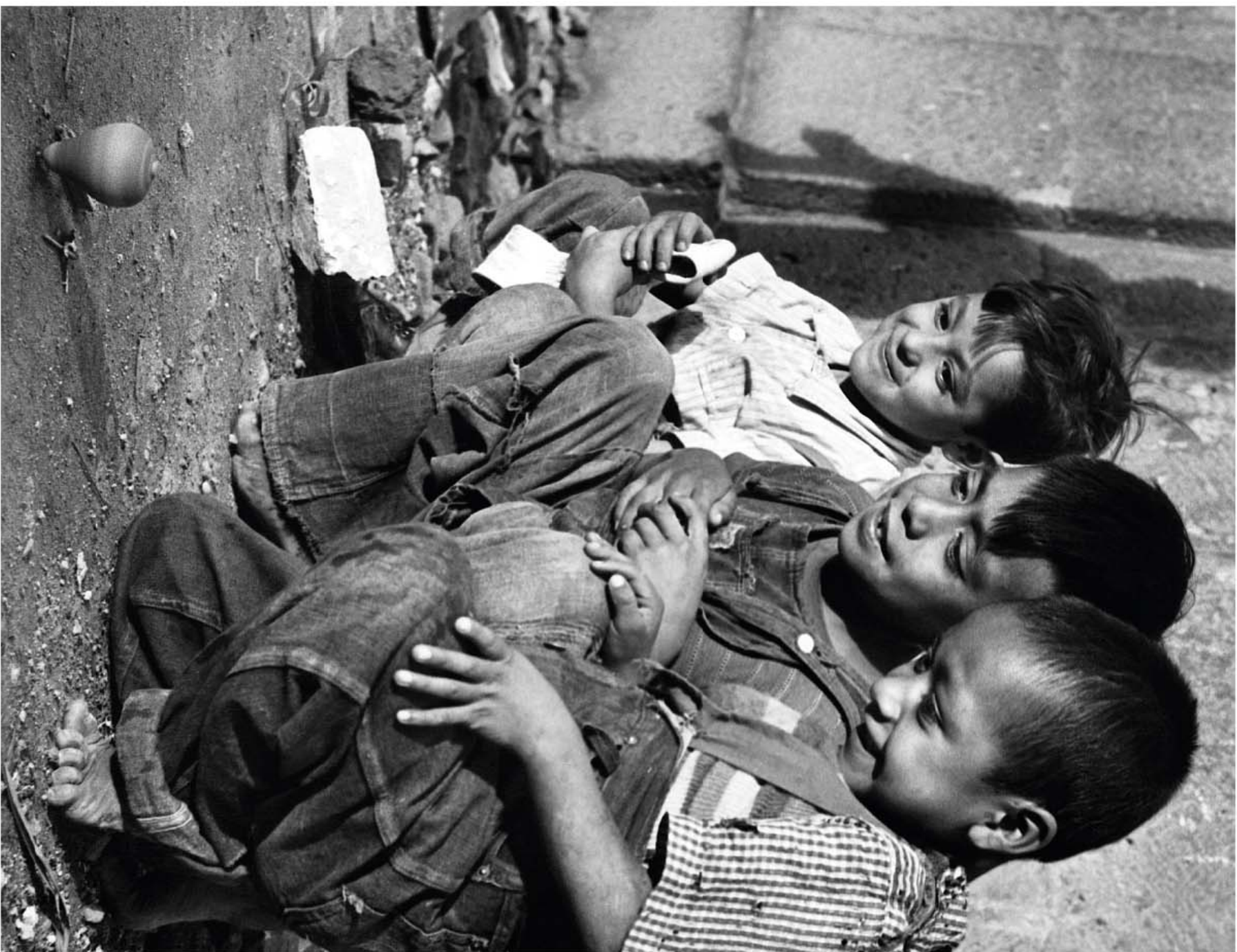
Niños juegan con trompo, NACHO LÓPEZ