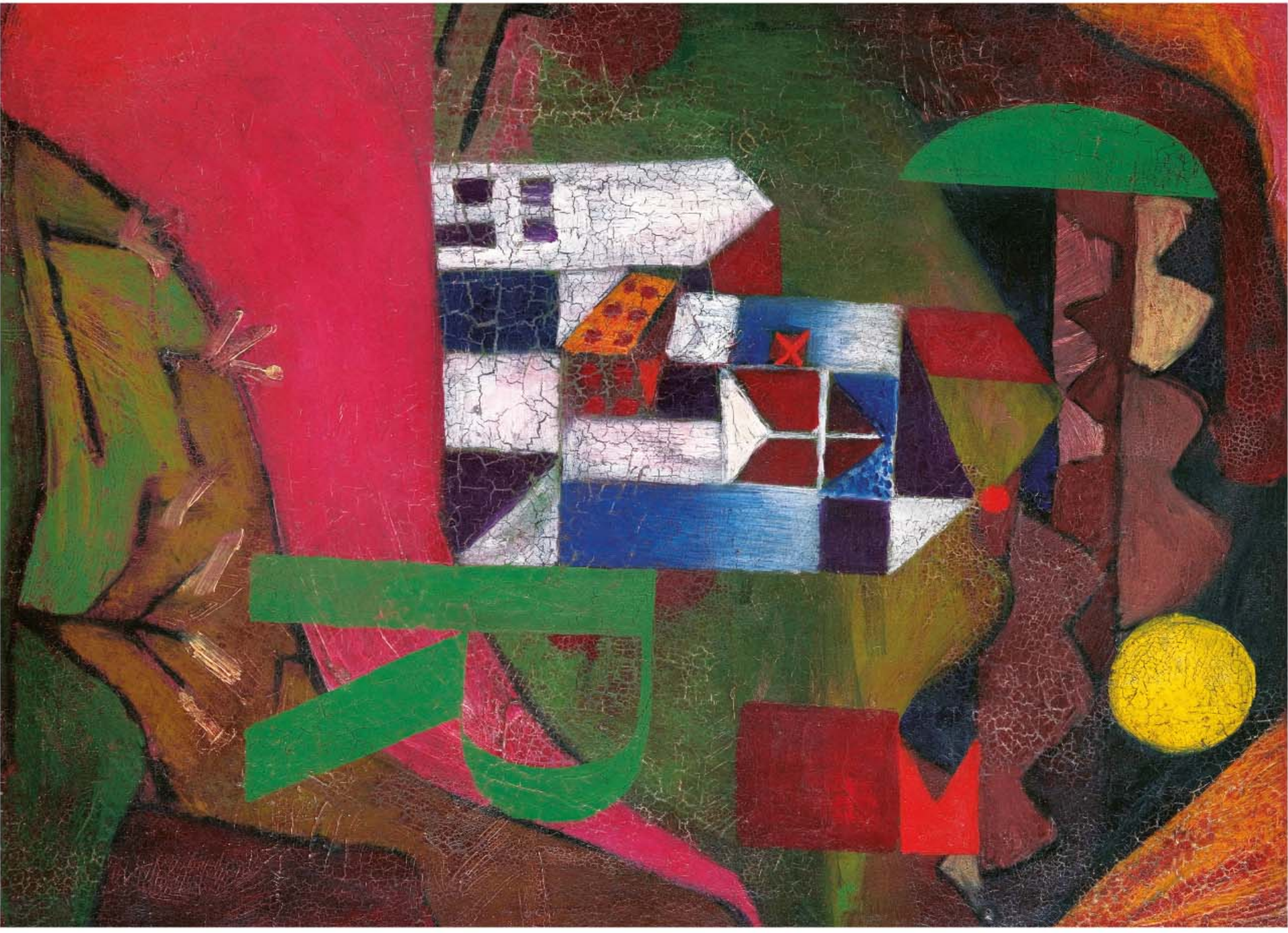
Villa R, PAUL KLEE